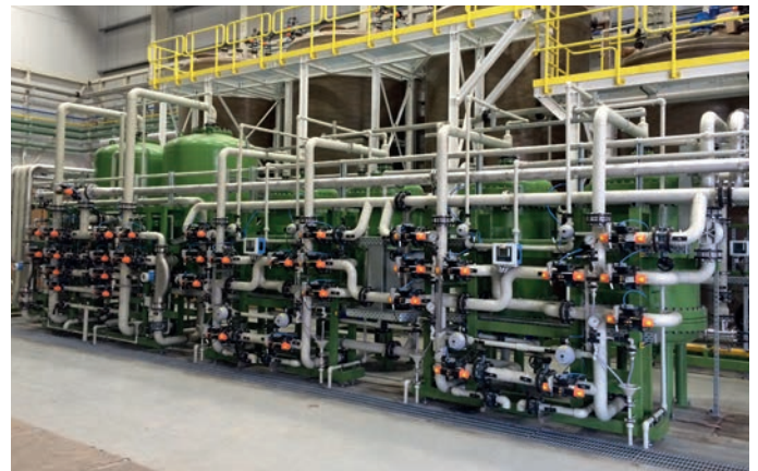
VE-Kreislauffanlage mit einer Kapazität von 25 m 3 /h für Spülwasserrecycling.

Unsere Lösungen bestehen durch eine lange Laufzeit, eine optimale Anpassung an die Rahmenbedingungen und einen hohen Wirkungsgrad bei geringem Energie- und Chemikalienverbrauch.